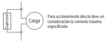
Esquema de conexión de supresores en cargas de accionamiento directo

Para accionamiento directo lleve en consideración la corriente máxima especificada.